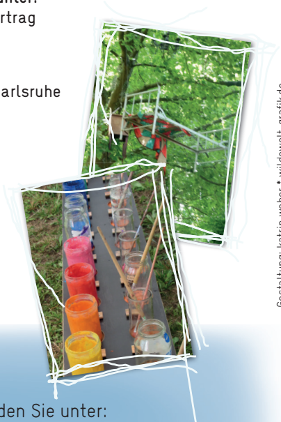
Gestaltung: katrin weber * wildewelt-grafik.de

Die Teilnehmer*innen erhalten am Ende der Zusatzausbildung ein Zertifikat mit detaillierten Angaben zu Inhalt und Umfang der Ausbildung